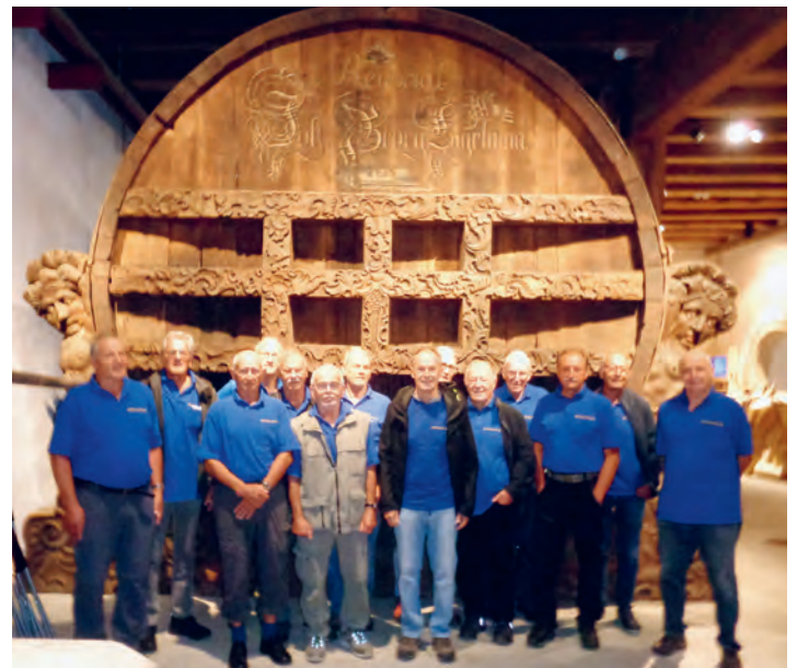
...so ein Fass!

Am späten Nachmittag folgte eine letzte Überraschung: Ein feines Vesper-Plättli im «Bistro Louis Napoleon» / Arenenberg. 15 zufriedene Wanderwegwölfe haben neue Energie getankt, um im Herbst nochmals Wege in Thal zu pflegen. mtl