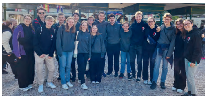
Ein Traum wurde wahr: Die Oberminis besuchten den Europapark Rust