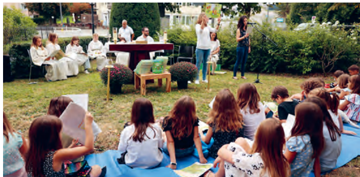
Die Vorstellung der Erstkommunionkinder erfolgte beim Lindenbaumgottesdienst.